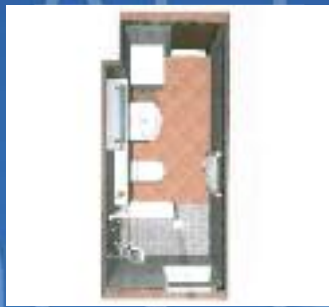
Wir erstellen Ihnen Badplanungen in 3D, individuell nach Ihren Wünschen.